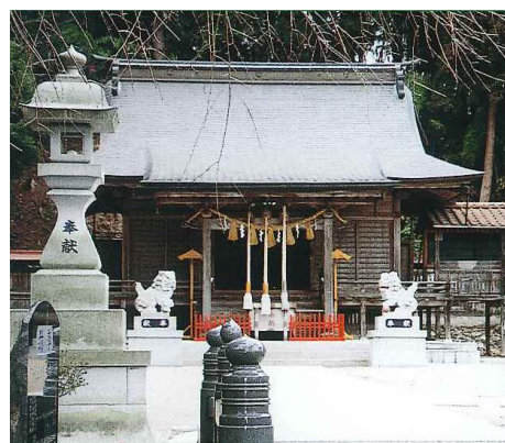
熊野本宮社 主祭神は家都子神 (けつみこのかみ)