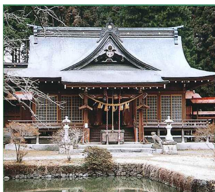
熊野神社 (旧熊野新宮社) 主祭神は熊野速玉男神 (くまのはやたまおのかみ)