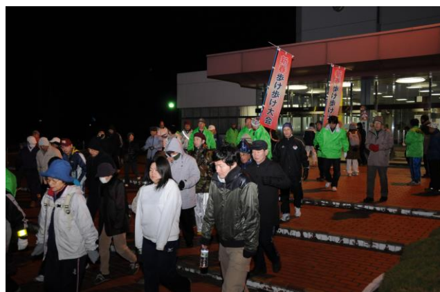
出発は夜明け前・・・

東日本大震災で亡くなられた方への追悼と震災復興への願いをこめて・・・ 恒例の新春歩け歩け大会を開催します。