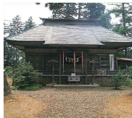
熊野那智神社 主祭神は熊野牟須美神 (くまのむすみのかみ)